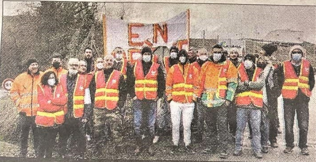
GRÈVE. Les personnels de la carrière des Malavaux demandent une revalorisation salariale.

La grande satisfaction des grévistes cussétois est de savoir qu'« environ 80 % des sites en France sont à l'arrêt », ce qui démontre, disent-ils, « une solidarité sans précédent ». « La grève sera reconduite en attendant des propositions décentes et dignes d'un grand groupe », ajoutent les personnels en grève qui s'estiment « mal récompensés des efforts fournis ».